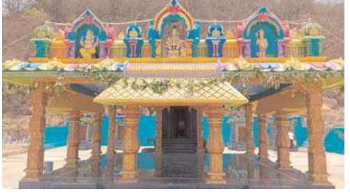
వంతం చేయవలసిందిగా అయ్యప్ప స్వామి దేవాలయ కమిటీ తెలిపారు.

భక్తులకు అసౌకర్యం కలగకుండా అన్ని ఏర్పాట్లు చేశారు. ఈ కార్యక్రమానికి అతిరథ మహారథులు హాజరుగానున్నారు. నేడు ఉదయం తొమ్మిది గంటల 54 నిమిషాలకు మూలా నక్షత్ర యుక్త మిథున లగ్న పుష్యరాంశయందు విగ్రహ ప్రతిష్ఠా మహోత్సవ కార్యక్రమానికి వేద విధులైన బ్రాహ్మణోత్తములచే ఘనంగా చేయనున్నారు. ఈ కార్యక్రమాన్ని వేలాది మంది హాజరై విజయ