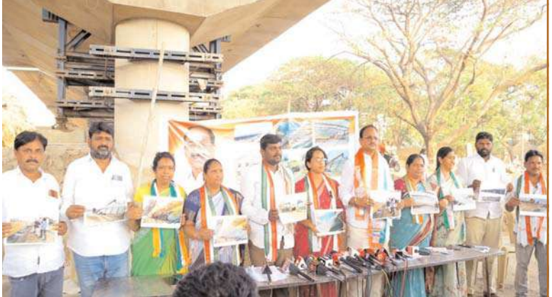
వివరించారు. పనుల్లో ఎలాంటి ఆలస్యం చోటుచేసుకోకుండా చర్యలు తీసుకుంటున్నట్లు పేర్కొన్నారు. నాణ్యత ప్రమాణాలను కచ్చితంగా పాటిస్తూ నిర్మాణం కొనసాగుతున్నట్లు తెలిపారు. అవసరమైన సాంకేతిక సదుపాయాలు వినియోగిస్తున్నట్లు చెప్పారు. ప్రజలకు ఇబ్బందులు కలగకుండా పనులు నిర్వహిస్తున్నట్లు వెల్లడించారు. పనుల పురోగతిపై తరచూ సమీక్షలు నిర్వహిస్తున్నట్లు తెలిపారు. నిర్ణీత గడువులో పనులు పూర్తి చేయడానికి కట్టుబడి ఉన్నామని స్పష్టం చేశారు.

వంటి సౌకర్యాలతో ప్రజలకు సురక్షిత రాకపోకలు కల్పించేలా రూపకల్పన చేసినట్లు చెప్పారు. ప్రస్తుతం పనులు తుదిదశకు చేరుకున్నాయని వెల్లడించారు. త్వరలోనే ప్రజలకు అందుబాటులోకి తీసుకురానున్నట్లు తెలిపారు. ట్రాఫిక్ రద్దీ సమస్యను గణనీయంగా తగ్గించడంలో ఇది కీలక పాత్ర పోషిస్తుందని పేర్కొన్నారు. నగర సౌందర్యాన్ని పెంచే ప్రతీకాత్మక నిర్మాణంగా ఇది నిలుస్తుందని అభిప్రాయపడ్డారు. భవిష్యత్ తరాలకు ఉపయోగపడే మౌళిక వసతిగా ఈ బ్రెడ్జి నిలవనుందని తెలిపారు. మున్నేరు ప్రా-టె-క్లన్ వాల్ ప్రాముఖ్యత : మున్నేరు ప్రా-టె-క్లన్ వాల్ నిర్మాణం ఖమ్మం నగర భద్రతకు కవచంగా నిలుస్తుందని నాయకులు పేర్కొన్నారు. మొత్తం 8.5 కిలోమీటర్ల పొడవున ఈ వాల్ నిర్మాణం కొనసాగుతోందని వివరించారు. వరద ముప్పును తగ్గించడంలో ఈ ప్రాజెక్టు కీలకంగా మారనుందని తెలిపారు. భారీ నిధులతో ఈ పనులు చేపట్టినట్లు వెల్లడించారు. గతంలో వరదల వల్ల ఎదురైన ఇబ్బందులను దృష్టిలో ఉంచుకొని ఈ ప్రాజెక్టును ప్రాధాన్యంతో అమలు చేస్తున్నట్లు చెప్పారు. వర్షాకాలానికి ముందే పనులు పూర్తి చేయాలని లక్ష్యంగా పెట్టుకున్నట్లు తెలిపారు. ప్రజల ప్రాణ, ఆస్తి రక్షణకు ఇది అత్యంత అవసరమని పేర్కొన్నారు. నగర భద్రతా వ్యవస్థలో ఇది కీలక భాగంగా నిలుస్తుందని అభిప్రాయపడ్డారు. వేగంగా సాగుతున్న పనులు : కేబుల్ బ్రెడ్జి, మున్నేరు వాల్ పనులు వేగవంతంగా కొనసాగుతున్నాయని నాయకులు తెలిపారు. అధికారుల పర్యవేక్షణలో పనులు నిరంతరంగా జరుగుతున్నాయని