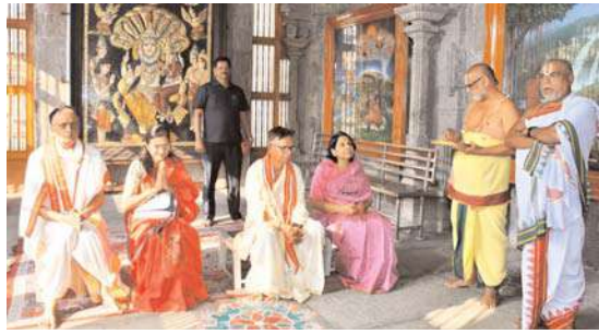
యాదగిరిగుట్ట లక్ష్మీ నరసింహ స్వామిని దర్శించుకున్న తెలంగాణ రాష్ట్ర ఎలక్షన్ కమిషనర్

వేద మంత్రాలు, మంగళ వాయిద్యాల నడుమ కన్నుల పండుగగా నృసింహ జయంతి వేడుకలు నిర్వహించారు. సాయంత్రం వేదస్వప్తి, నృసింహ ఆవిర్భావం,బుత్తిక్ సన్మానం, మహా నివేదన, తీర్థ ప్రసాద గోష్టి తో ఉత్సవ పరిసమాప్తి పలికారు ఆలయ అధికారులు.