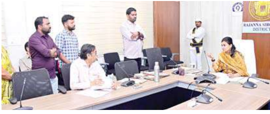
నిబంధనలకు అనుగుణంగా సిబ్బంది బదిలీల ప్రక్రియ