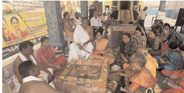
అయ్యప్ప స్వామి దేవాలయంలో హోమాలు,పడిపూజ,అభిషేకం