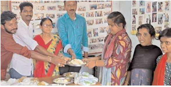
అన్నం పరబ్రహ్మ స్వరూపం.యువ సంకల్ప ఫౌండేషన్