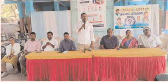
సిబ్బంది తదితరులు పాల్గొన్నారు.