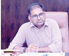
వార్తా లోపలి పేజీలో

○ సర్ కార్యక్రమం పై పత్రిక ప్రకటన విడుదల చేసిన జిల్లా కలెక్టర్