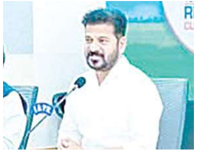
నిర్ణయం తీసుకున్నట్లు వెల్లడించారు.