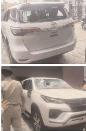
శ్రేణుల మధ్య నెలకొన్న ఉద్రిక్తతతో జిల్లాలో రాజకీయ వాతావరణం మరింత వేడైంది.

కార్యాలయంలోని ఫర్నిచర్ను కూడా ధ్వంసం చేసినట్లు సమాచారం. బండి సంజయ్ పై చేసిన వ్యాఖ్యలను వెంటనే వెనక్కి తీసుకుని క్షమాపణ చెప్పాలని డిమాండ్ చేస్తూ బీజేపీ కార్యకర్తలు నిరాదాలు చేశారు. పరిస్థితి ఉద్రిక్తంగా మారడంతో పోలీసులు రంగంలోకి దిగి కార్యకర్తలను అడ్డుకునే ప్రయత్నం చేశారు. ఆందోళనకారులు అదుపు తప్పడంతో పోలీసులు లాఠీచార్జ్ చేసి వారిని చెదరగొట్టారు. ఈ తోపులాటలో పలువురు కార్యకర్తలకు స్వల్ప గాయాలు అయినట్లు తెలుస్తోంది. ప్రస్తుతం గంగుల కమలాకర్ క్యాంప్ ఆఫీస్ వద్ద భారీగా పోలీసు బలగాలు మోహరించగా, కరీంనగర్ పట్టణంలో అదనపు నిఘా ఏర్పాటు చేశారు. బీజేపీ-బీఆర్ఎస్