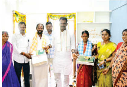
కల నెరవేరిందని ఎమ్మెల్యే పేర్కొన్నారు. ఈ కార్యక్రమంలో ఆయా గ్రామాల కాంగ్రెస్ పార్టీ నాయకులు కార్యకర్తలు, సర్పంచులు మాజీ సర్పంచ్ లు ప్రజాప్రతినిధులు తదితరులు పాల్గొన్నారు.

మిద్దెల్లో ఇబ్బందులు ఎదుర్కొంటున్నారని రేవంత్ రెడ్డి కాంగ్రెస్ ప్రభుత్వం వచ్చిన తర్వాత నిరుపేదలకు 5 లక్షల విలువగల ఇందిరమ్మ పిల్లతో తమ సొంత ఇంటి కల నెరవేరిందని స్థానిక శాసనసభ్యులు తూడి మేఘారెడ్డి కి కాంగ్రెస్ ప్రభుత్వానికి హృదయపూర్వక కృతజ్ఞతలు తెలియజేశారు. ఈ సందర్భంగా ఎమ్మెల్యే మాట్లాడుతూ ఎన్నో ఏళ్లుగా సొంత ఇంటిని నిర్మించుకోవాలని కల్లుదన్న నిరుపేద కుటుంబాలు ఆ కళా సహకారం కాకపోవడంతో సంవత్సరాలుగా ఇబ్బందులు ఎదుర్కొంటున్నారని నేడు కాంగ్రెస్ ప్రభుత్వ హయాంలో ఇందిరమ్మ ఇండ్లు మంజూరు చేయడం ద్వారా ప్రతి ఒక్క నిరుపేద సొంత ఇంటి