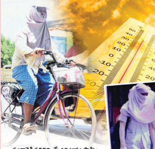
సంగారెడ్డి ప్రతినిధి, మే 19 (జనంసాక్షి) :

జిల్లా వ్యాప్తంగా ఎండలు గతంలో ఎన్నడూ లేని విధంగా తీవ్రమైన వేడిమితో ప్రజలను అందోళనకు గురవుతున్నాయి. ఉదయం 9 గంటలనుంచే మాడ చుర్రు మనిషివే విధంగా తీవ్రమైన వేడిమితో ఎండలు కాస్తుండటంతో ప్రజలు ఉదయం 10 గంటల తరువాత రోడ్డుపైకి రావాలంటేనే భయపడాలి వస్తోంది. జిల్లా వ్యాప్తంగా పలు మండలాలలో 40 నుంచి 45 డిగ్రీల వరకు ఉష్ణోగ్రతలు నమోదైస్తున్నాయి. అధికారులు తెలియజేస్తున్నారు. ఇప్పటికే వాతావరణశాఖ హెచ్చరిక కలు చేస్తూ వస్తోంది. రానున్న రోజులలో ఎండలు మరింత వేడిగా ఉంటాయని చెబుతున్నాయి. ముఖ్యంగా ఉదయం 10 గంటల తరువాత వాతావరణం వేగంగా తీవ్రమై పడుతున్నాయి. ద్వీపక్రవాహన దారులు, అగ్ని నిర్మాణ సమితి వారు ఎండల వేడిమితో ఎక్కడిక్కడ చచ్చి నీరు తాగుతున్నారు. జిల్లావ్యాప్తంగా మే నెల ప్రారంభం నుంచి గర్భిస్తున్న ఎండలతో వయసు మీదన వృద్ధులు వెలుగు వయసు కలిగిన పసిపిల్లలు వడగాల్లులకు తట్టుకుంటూ అనే అందోళన సర్దుతూ వున్నారని అభ్యంతరం పాలు ఇక్కడో పెంచే పెంపుడు కోళ్లు పెరుగుతున్న ఉష్ణోగ్రతలకు తట్టుకోలేక మృతి చెందుతున్నాయి. మొత్తంగా సంగారెడ్డి జిల్లాలో పెరుగుతున్న ఉష్ణోగ్రతలు అందోళన కలిగిస్తున్నాయి. సంగారెడ్డి జిల్లాలోని సంగారెడ్డి, సదాశివపేట,