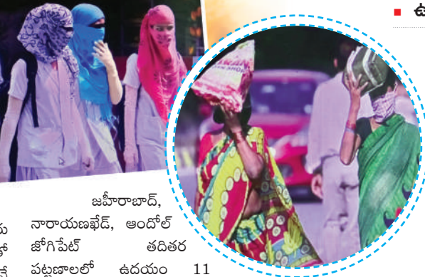
జూబిలాబాద్, ఆంధోల్ జోగిపేట్ తదితర పట్టణాలలో ఉదయం 11 గంటల తర్వాత రోడ్డుపైకి వాహనదారులు, పాదాచారులు తిరగడం లేదు. రోడ్డునీ కర్కాసు తలపిస్తూ నిర్మాణపని ఉంటున్నాయి.

జిల్లా వ్యాప్తంగా ఎండలు గతంలో ఎన్నడూ లేని విధంగా తీవ్రమైన వేడిమితో ప్రజలను అందోళనకు గురవుతున్నాయి. ఉదయం 9 గంటలనుంచే మాడ చుర్రు మనిషివే విధంగా తీవ్రమైన వేడిమితో ఎండలు కాస్తుండటంతో ప్రజలు ఉదయం 10 గంటల తరువాత రోడ్డుపైకి రావాలంటేనే భయపడాలి వస్తోంది. జిల్లా వ్యాప్తంగా పలు మండలాలలో 40 నుంచి 45 డిగ్రీల వరకు ఉష్ణోగ్రతలు నమోదైస్తున్నాయి. అధికారులు తెలియజేస్తున్నారు. ఇప్పటికే వాతావరణశాఖ హెచ్చరిక కలు చేస్తూ వస్తోంది. రానున్న రోజులలో ఎండలు మరింత వేడిగా ఉంటాయని చెబుతున్నాయి. ముఖ్యంగా ఉదయం 10 గంటల తరువాత వాతావరణం వేగంగా తీవ్రమై పడుతున్నాయి. ద్వీపక్రవాహన దారులు, అగ్ని నిర్మాణ సమితి వారు ఎండల వేడిమితో ఎక్కడిక్కడ చచ్చి నీరు తాగుతున్నారు. జిల్లావ్యాప్తంగా మే నెల ప్రారంభం నుంచి గర్భిస్తున్న ఎండలతో వయసు మీదన వృద్ధులు వెలుగు వయసు కలిగిన పసిపిల్లలు వడగాల్లులకు తట్టుకుంటూ అనే అందోళన సర్దుతూ వున్నారని అభ్యంతరం పాలు ఇక్కడో పెంచే పెంపుడు కోళ్లు పెరుగుతున్న ఉష్ణోగ్రతలకు తట్టుకోలేక మృతి చెందుతున్నాయి. మొత్తంగా సంగారెడ్డి జిల్లాలో పెరుగుతున్న ఉష్ణోగ్రతలు అందోళన కలిగిస్తున్నాయి. సంగారెడ్డి జిల్లాలోని సంగారెడ్డి, సదాశివపేట,