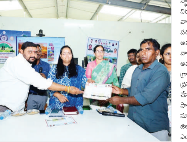
వరకు అన్ని మండలాలు, గ్రామపంచాయతీలు, రైతు వేదికలు, క్లస్టర్