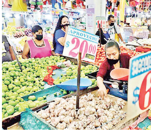
మార్కెట్లో వివిధ పండ్లు, కూరగాయలు.

ఎక్స్ట్రా డెబ్బ తగిలితే మెక్సికో నోప్పి రావడం అంటే ఇదే. పశ్చిమాసియాలో కొనసాగుతున్న యుద్ధం లాటిన్ అమెరికా దేశాలను కుంగదీస్తోంది. ఇంధన ధరల మంట ఈ దేశాల్లో లక్షలమంది జీవితాల్ని ప్రమాదంలోకి నెట్టిస్తోంది. ప్రజా రవాణా చతికిలబడుతోంది. ఆహార ధరలు చుక్కలనంటుతున్నాయి. పశ్చిమాసియా యుద్ధం ఇప్పటికప్పుడు ఆగిపోయినా.. లాటిన్ అమెరికా ఆర్థిక వ్యవస్థలు కోలుకోవడానికి చాలాకాలం పడుతుందని ఆర్థికవేత్తలు విశ్లేషిస్తున్నారు. ఆర్థికాధిపతి ప్రవృత్తులకు కట్టడికి ఆహారపాల పడుతున్న ఆర్థికాధిపతి పశ్చిమాసియా యుద్ధం గోరుచుట్టపై రోకలిపోతున్నా తయారైంది. జీవనవ్యయం విపరీతంగా పెరుగుతోందని జీవయర్ మిల్ ప్రభుత్వం చెబుతోంది. యుద్ధం మొదలైనప్పటి నుంచి ఆర్థికాధిపతి ఇంధన ధరలు 20% కంటే ఎక్కువగా పెరిగాయి. దీంతో ప్రభుత్వం ప్రజా రవాణాకు కోతపెడుతోంది. బస్సుల సంఖ్యను తగ్గిస్తోంది. ఫలితంగా నగర కేంద్రాల్లో, రద్దీ సమయంలో పొడవైన క్యూలైన్లు, ఆనహనానికి గురైన ప్రయాణికులు కనిపిస్తున్నారు. యుద్ధం కారణంగా మార్కెట్ ఇంధన ధరలు 9%, దేశీయ విమాన