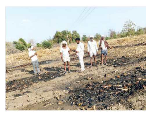
తేరుకోకముందే, ఆదివారం రంజిని తండా గ్రామ శివారలో మరో ప్రమాదం చోటుచేసుకుంది. నిల్వ ఉంచిన మొక్కజోన్న కుప్పలు విద్యుత్ షార్ట్ సర్క్యూట్లో ఒక్కసారిగా అంటుకున్నాయి. అటుగా వెళ్తున్న రైతులు అప్రమత్తమై, వ్యవసాయ బోరు మోటార్ల ద్వారా సీళ్ళు చల్లి మంటలను అదుపు చేయడంతో పెద్ద ప్రమాదం తప్పింది. అయినప్పటికీ గణనీయమైన నష్టం సంభవించింది. వరుసగా

కండ్లముందే బూడిదవుతున్న 'బంగారు' పంట రైతన్నలకు ప్రభుత్వం అందగా నిలవాలి.. లేదంటే ఆందోళన తప్పదు: జాడవ్ వికాస్ బిరోఎస్ నాయకుడు కుభీర్, మే 03, (జనంసాక్షి): కుభీర్ మండలంలో రైతన్నల కష్టం మంటల్లో కాలిపోతోంది. అహోరాత్రులు శ్రమించి పండించిన మొక్కజోన్న పంట, చేతికొచ్చే తరుణంలో వరుస అగ్నిప్రమాదాలకు ఆహుతవుతుండడంతో రైతులు కన్నీరుమున్నీరవుతున్నారు. గత కొన్ని రోజులుగా మండలంలోని వివిధ గ్రామాల్లో జరుగుతున్న ఈ ప్రమాదాలు అన్యదాతలకు కంకులతో దెబ్బ తీస్తున్నాయి. రెండు రోజుల క్రితమే దార కుభీర్, పార్లి (3), నిగ్గా గ్రామాల్లో విద్యుత్ షార్ట్ సర్క్యూట్ కారణంగా దాదాపు 42 ఎకరాల్లో మొక్కజోన్న పంటలు దగ్ధమయ్యాయి. ఆ నష్టం నుంచి