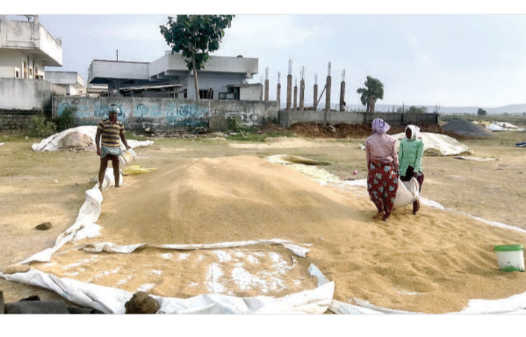
ఎకరాల వరకు యాసంగి వరి పంటను పండించారు. ఇప్పటికే సగం ధాన్యం కూడా బయటకు వెళ్లలేదు. ఈ నెలాఖరు వరకు వరి కోతలు ధాన్యపు రాశులు ఉండే అవకాశం ఉంది. కానీ ప్రతిరోజు సాయంత్రం వేళ ఆకాశం మేఘావృతం కావడం ఉరుములు మెరుపులు రైతులకు కంటిమీద కుసుకు లేకుండా చేస్తున్నాయి. మండల వ్యాప్తంగా 18 గ్రామ పంచాయతీలలో బకెపి ద్వారా 11

ఉదయం దాన్ని ఆరబోత.. సాయంత్రం పోగు చేయడం గాలిలో పరదాలు లేచిపోతున్నాయి గోవిందరావుపేట, మే 3 (జనంసాక్షి) : ప్రతిరోజు ఎక్కడ వర్షం వస్తుందో అని రైతులు వణికిపోతున్నారు. ఉదయం పూట ఎండ మొదలవగానే ధాన్యాన్ని ఆరబోయడం సాయంత్రం వేళ ఉరుములు భారంగా మారడం రైతుల అంటున్నారు. ఆదివారం సాయంత్రం ఉరుములు మెరుపులు గాలులు వస్తుండడంతో ధాన్యపు రైతులు బెంటెలిపోయారు. అగ్రమేఘాల మీద పరిగెత్తుకు వచ్చి ధాన్యపు రాకులను పోగుచేసి వదాలు కప్పకున్నారు. గాలి వేస్తుండడంతో కప్పతున్న పరదాలు లేచిపోతుండడంతో పదే పదే వాటిని తీసుకువచ్చి కప్పడం వాటిపై బరువులు పోయడం రైతులకు కష్టంగా మారింది. యాసంగిలో సుమారు 6000 ఎకరాల్లో లక్కపరం చెరువు కింద రైతులు రబీ వరి సాగు చేశారు. అంతేకాక చిన్న చిన్న చెరువులు కుంటలు బోర్ల కింద మరో 2000