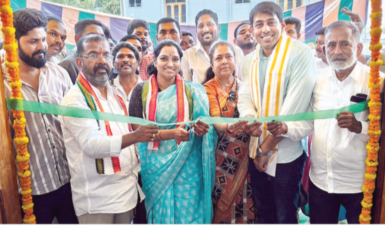
నదుపాలన మెరుగుపరచేందుకు కృషి చేస్తోందని తెలిపారు. ముఖ్యంగా పేద, మధ్యతరగతి ప్రజలకు ఉచిత వైద్య సేవలు అందేలా చర్యలు తీసుకుంటున్నామని చెప్పారు. ఈ కేంద్రంలో అందించే సేవలను ప్రజలు పూర్తిగా వినియోగించుకోవాలని, ఆరోగ్య పరిరక్షణలో ముందుండాలని కోరారు. ప్రజలకు ఎలాంటి వైద్య సమస్యలు