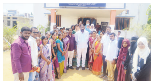
అందించేందుకు కృషి చేస్తున్నామని అన్నారు. అమరచింతలో ప్రత్యేకంగా షెడ్యూల్ నిర్మించి హైదరాబాద్ నుంచి కంపెనీల ద్వారా మహిళలకు ఉపాధి అందిస్తున్నామని తెలిపారు. మక్తల్ లో సైతం పెద్దపెద్ద షెడ్యూల్ నిర్మించి మహిళలకు ఉపాధి అందిస్తామని భరోసా ఇచ్చారు. ప్రభుత్వ పాఠశాలలో అన్ని విద్యార్థులకు యూనిఫామ్ లను కట్టి ఉపాధిని సెట్టింగ్ లో శిక్షణ