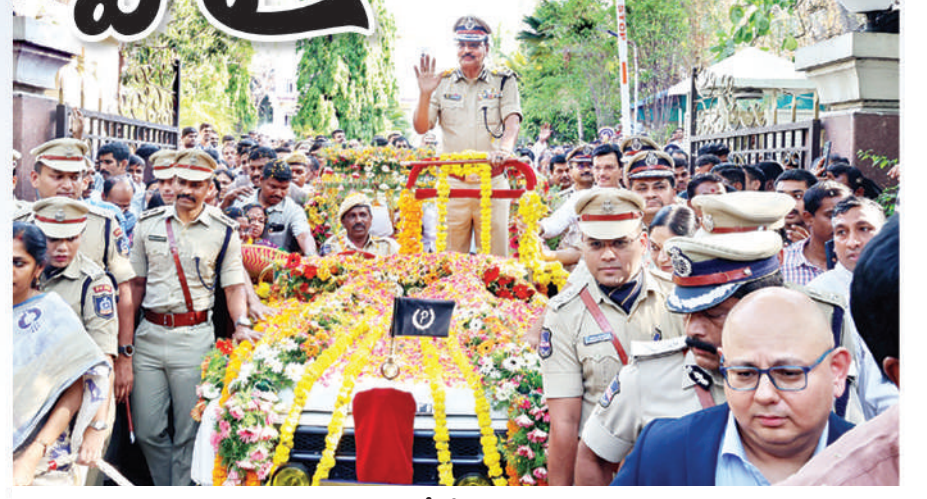
హైదరాబాద్ పోలీస్ లాడమీలోని పరేడ్ గ్రౌండ్ లో డీజీపీ శివధర్ రెడ్డికి పోలీసు ఉన్నతాధికారుల గౌరవ వీడ్కోలు

హైదరాబాద్ పోలీస్ పరేడ్ గ్రౌండ్ లో పోలీసు ఉన్నతాధికారులు గౌరవ వీడ్కోలు