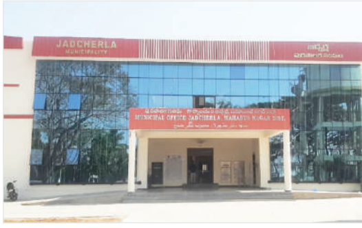
అప్పన్ నభ్యుల నియామకం జరగకపోవడం గమనార్హం. పదవీకాలం ముగుస్తుండడంతో గత నెలలో చివరి కౌన్సిల్ సమావేశం నిర్వహించి కొన్ని పనులకు ఆమోదం తెలిపారు.

జడ్చర్ల, ఏప్రిల్ 30 (జనంసాక్షి) : జడ్చర్ల మున్సిపాలిటీలో బడ్జెట్ ప్రజాస్వామ్య పాలన ముగింపు దశకు చేరుకుంది. 2021 మే 7న బాధ్యతలు చేపట్టిన ప్రస్తుత పాలకవర్గం పదవీ కాలం ఈనెల మే 6వ తేదీతో పూర్తి కానుంది. గడువు ముగియడానికి మరో వారం రోజులే సమయం ఉన్నా, తదుపరి ఎన్నికల నిర్వహణపై ప్రభుత్వం నుండి ఎలాంటి స్పష్టత రాకపోవడంతో... మే 7వ తేదీ నుండి జడ్చర్ల మున్సిపాలిటీ అధికారికంగా ప్రత్యేక అధికారుల పాలనలోకి వెళ్లడం ఖాయమైంది.