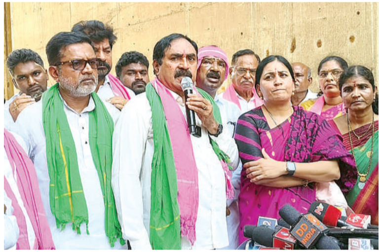
వార్త మెయిన్ 7లో

□ మూడేళ్ల నుంచి తెలంగాణ రైతులను గోస పెట్టిన ముఖ్యమంత్రి □ మేడిగడ్డ సందర్భంలో మాజీ మంత్రి ఎర్రబెల్లి దయాకర్ రావు మహాదేవపూర్: ఏప్రిల్ 18 (జనంసాక్షి) : రాష్ట్ర మాజీ ముఖ్యమంత్రి కేసీఆర్ బయటకు వస్తుందంటేనే సీఎం రేవంత్ రెడ్డికి భయం వట్టుకుందని ఆనాడు నల్గొండ ఈనాడు జగిత్యాల సభలను ఫెయిల్ చేయాలని రేవంత్ రెడ్డి చూస్తుండని మేడిగడ్డ బ్యారేజీకి వచ్చి ఏం చేస్తాడో ప్రజలకు సమాధానం చెప్పాలని మేడిగడ్డ బ్యారేజీ గేట్లను ఎత్తి మూడేళ్ల నుంచి తెలంగాణ రైతులను గోసపెడుతున్నాడని మాజీ మంత్రి ఎర్రబెల్లి దయాకర్ రావు అన్నారు.