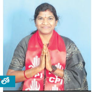
వార్డు మెయిన్ 7లో