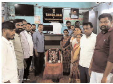
మహబూబనగర్లో, మహాదేవపూర్, ఏప్రిల్ 26 (జనంసాక్షి).