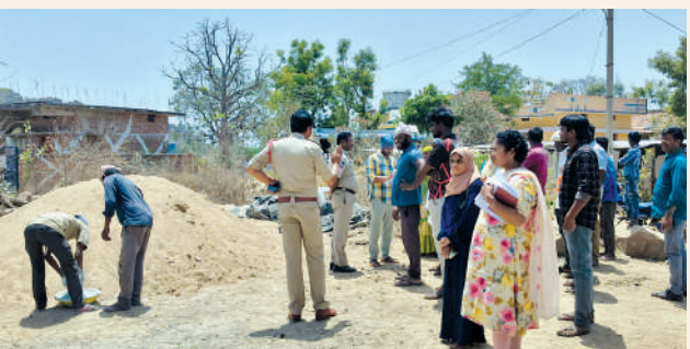
మెదక్ జిల్లా బ్యూరో చీఫ్, ఏప్రిల్ 8 (జనం సాక్షి) :