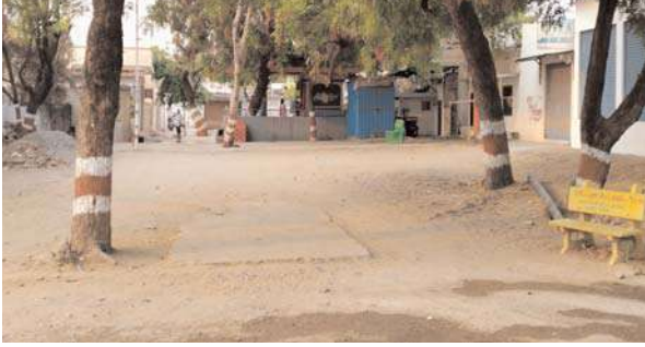
ప్రణాళికలు రూపొందించి స్థలాన్ని సద్వినియోగం చేయాలని ప్రజలు విజ్ఞప్తి చేస్తున్నారు.

కబ్జాకు గురయ్యే ప్రమాదం ఉందని వాపోతున్నారు. ఇప్పటికైనా మున్సిపాలిటీ అధికారులు, పాలక వర్గం స్పందించి ఈ స్థలానికి చుట్టూ హద్దులు ఏర్పాటు చేసి కంచె వేయాలని కోరుతున్నారు. అంతేకాకుండా, మున్సిపాలిటీకి ఆదాయం సమకూరేలా వాణిజ్య సముదాయం లేదా ఇతర