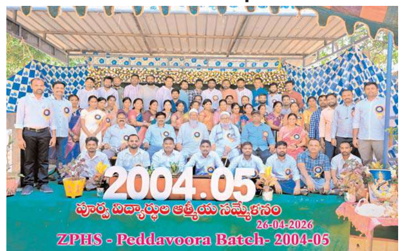
2004.05 పూర్వ విద్యార్థుల ఆత్మీయ సమ్మేళనం 26-04-2026 ZPHS - Peddavoora Batch- 2004-05

వయసు పెరిగినా, హోదాలు మారినా.. స్నేహితుల