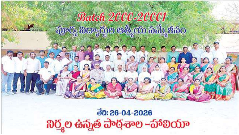
Batch 2000-20001 పూర్వ విద్యార్థుల ఆత్మీయ సమ్మేళనం