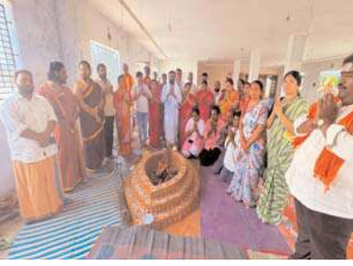
బృందం తదితరులు పాల్గొన్నారు.