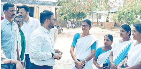
సంబంధిత శాఖ అధికారులు తదితరులు పాల్గొన్నారు.