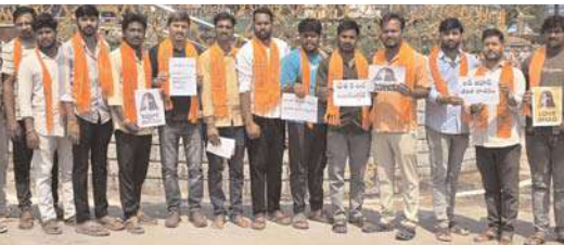
ఆర్మర్, ఏప్రిల్ 17 ( జనసాక్షి):