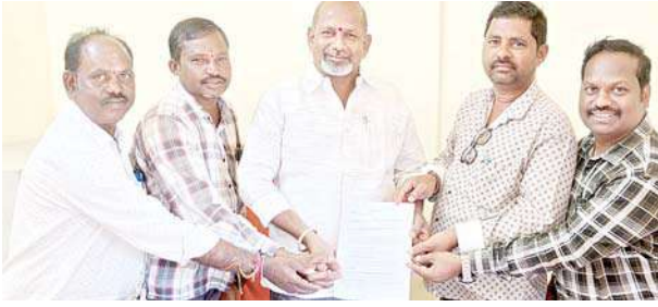
మున్నూరుకాపు భవన నిర్మాణానికి పూర్తి సహకారం అందిస్తూ