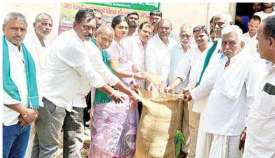
కొనుగోలు కేంద్రాలను రైతులు సద్వినియోగం చేసుకోవాలి