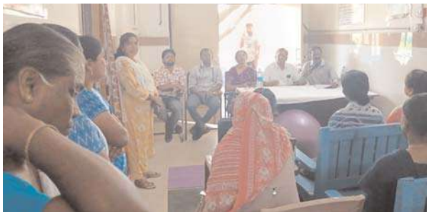
సురక్షిత మాతృత్వం కార్యక్రమం ప్రారంభించిన