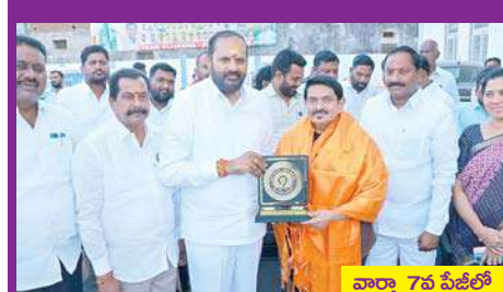
వార్తా 7వ పేజీలో

- ఆరోగ్యశ్రీ, డి-హాబ్ సేవల్లో రాష్ట్రంలోనే పెద్దపల్లి జిల్లా ప్రభుత్వ ఆసుపత్రి అగ్రస్థానం - ప్రభుత్వ విప్ పెద్దపల్లి చింతకుంట విజయరమణా రావు