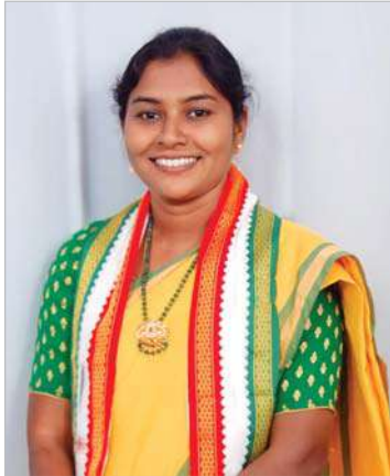
ప్రభుత్వం ముందడుగు వేసిందని ఆ బిల్లు అమలుకు అప్పుడు సహకరించకుండా కేవలం ఎన్నికల లబ్ధి కోసమే బీజేపీ ఉపయోగిస్తుందని మండిపడ్డారు.