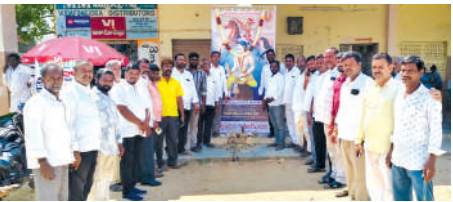
ఖిల్లాలో ఘనంగా సర్దార్ సర్వాయి పాపన్న గౌడ్ వర్గం వేడుకలు