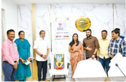
ఘనంగా నివాళులర్పించిన మంత్రి దామోదర్ రాజనర్సింహ