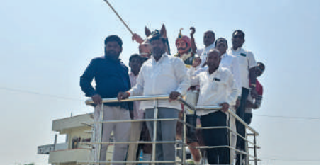
నంగునూరు మండల కేంద్రంలో సర్దార్ సర్వాయి పాపన్న గౌడ్ వర్గం సంకల్పంగా ఘనంగా నివాళులు