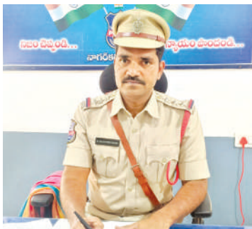
వారికి సంబంధించిన సైబల్ ఆఫీసర్లను తీసుకొని వచ్చి వారి యొక్క ఫిర్యాదులను న్యాయం చేసే విధంగా చేస్తామని జిల్లా ఎస్పీ సుబ్బం చేతారని తెలిపారు. ఈ కార్యక్రమం ద్వారా పోలీసింగ్ సేవలు మరింత సమర్థవంతంగా, బాధితుల సౌకర్యంగా అందుతాయని ఆయన ఆశాభావం వ్యక్తం చేశారు.

వేగంగా ఎఫ్ఐఆర్ నమోదు చేయడం. ఇలా వారికి త్వరగా న్యాయం అందించడమే లక్ష్యమని చెప్పారు. ముఖ్యంగా పోక్సన్ కేసులు, ఈవ్ టీజింగ్, తీవ్రమైన శారీరక నేరాలు, చైల్డ్ మ్యారేజ్, దొంగతనాలు, గృహ హింస, యాక్సిడెంట్, చైల్డ్ లేబర్ యాక్ట్, పని ప్రదేశంలో హారాస్మెంట్, మహిళలపై జరిగే ఏ విధమైన నేరాలపైన మహిళ పోలీస్ ఆఫీసర్ తో కలిసి వచ్చి వారి యొక్క ఫిర్యాదును స్వీకరించి న్యాయం చేసే విధంగా సహకరిస్తామని కాల్ చేసిన వెంటనే పోలీస్ వారు వేగంగా స్పందించి బాధితుల ఇంటి దగ్గరే ఎఫ్ఐఆర్ నమోదు చేస్తామని తెలిపారు. ఒకవేళ మూగ చెవిడి కండ్లు లేని వాళ్ళ యొక్క ఫిర్యాదులను