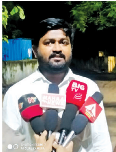
నిర్మూలించాలని డిమాండ్ చేశారు.

బెల్ట్ షాపులకు తెల్లవారజామున నుండే మద్యం సరఫరా జరుగుతున్నా సంబంధిత అధికారులు పట్టించుకోవడం లేదని విమర్శించారు. అలాగే యువత మద్యం బానిసత్వానికి లోనవకుండా అవగాహన కార్యక్రమాలు నిర్వహించాలని సూచించారు. సమాజంలో శాంతి భద్రతలు కాపాడాలంటే మద్యం పై ఉక్కుపాదం అవసరమని ఆయన స్పష్టం చేశారు. మద్యం మత్తులో విషాదకర ఘటనలు చోటుచేసుకుంటున్నాయి. కంగ్రి మండలం చౌకన్ పల్లి గ్రామంలో మద్యం మత్తులో పురుగుల మందు తాగిన ఘటన చోటుచేసుకుందన్నారు. ఇలాంటి ఘటనలు రోజురోజుకూ పెరుగుతున్నాయని ఆందోళన వ్యక్తం చేస్తున్నారు. ఇప్పటికైనా ప్రభుత్వం మరియు ఎక్సైజ్ శాఖ వెంటనే స్పందించి మద్యం పై కఠిన చర్యలు తీసుకోవాలని, అక్రమ బెల్ట్ షాపులను పూర్తిగా