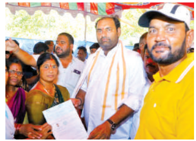
నాయకులు, ప్రజాప్రతినిధులు, లబ్ధిదారులు పాల్గొన్నారు.

పరిస్థితుల్లో చికిత్స కోసం ఆర్థికంగా ఇబ్బందులు పడకుండా ఉండేందుకు సీఎంఆర్ఎఫ్ సహాయం ఎంతో కీలకంగా మారందని పేర్కొన్నారు. ముఖ్యమంత్రి రేవంత్ రెడ్డి నాయకత్వంలో ప్రజా సంక్షేమమే ధ్యేయంగా ప్రభుత్వం పనిచేస్తోందని, అర్హులైన ప్రతి ఒక్కరికీ ప్రభుత్వ ఫలాలు అందేలా తాము నిరంతరం శ్రమిస్తున్నామని చెప్పారు. నియోజకవర్గ ప్రజల ఆరోగ్య భద్రతకు ప్రభుత్వం పెద్దపీట వేస్తోందని, బాధితులకు ఈ ఆర్థిక సహాయం అండగా నిలుస్తుందని ఆశాభావం వ్యక్తం చేశారు. కార్యక్రమంలో స్థానిక