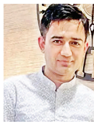
రోజుకు 650- 700 ఆస్ట్రేలియా డాలర్లు (భారత్ కరెన్సీలో దాదాపు రూ.46వేలు) సంపాదించిన వివరించారు. భారత్ లో ఒక నెలంకా పనిచేసి తాను

న్యూఢిల్లీ: మెరుగైన జీవనశైలి, ఉద్యోగం, ఎక్కువ జీతం కోసం అనేకమంది భారతీయులు విదేశాలకు తరలిపోతూ ఉంటారు. అలా ఆస్ట్రేలియాకు వెళ్లిన ఓ భారతీయుడు వెస్ట్ సైడ్ స్టామాక్ట్ మ్యాజిక్ లో టెగ్ వైరల్ అవుతోంది. ఆస్ట్రేలియాలో తన ఒక రోజు జీతం.. భారత్ లో నెలవారీ సంపాదనకు సమానమని పేర్కొన్నారు. ఈ సందర్భంగా సుదీర్ఘ పని గంటల గురించి మాట్లాడారు. ప్రస్తుతం ఇవి నెట్టింట తీవ్ర చర్చకు దారితీశాయి. భారతీయ మూలాలన్న రివీండర్ ప్రస్తుతం ఆస్ట్రేలియాలో నివసిస్తున్నారు. ఆయన ఇన్ స్ట్రూగామ్ లో ఇటీవల ఓ పోస్టు పెట్టారు. అందులో ఆయన మాట్లాడతూ.. ఉదయం 7 గంటలకు తాను వర్క్ మొదలుపెడితే.. పూర్వయ్యసరికి ఆర్జికృతి అవుతుందన్నారు. అయినా, తన శరీరం అలాని పోదన్నారు.