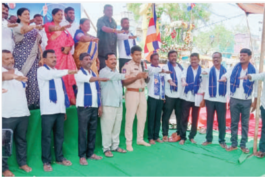
అన్నారు. ద్వైత వాహనదారులు తప్పకుండా హెల్మెట్ ధరించండి అని అన్నారు. అలాగే నాలుగు చక్రాల వాహన దారులు తప్పకుండా సీట్ బెల్ట్ విధిగా ధరించి ప్రయాణం చేయాలని ఎస్సె పి అన్నారు. వాహన దారులు డ్రైవింగ్ లో మద్యం సేవించి వాహనం నడవవద్దని ఎస్సె పి సూచించారు. అలాగే డ్రైవింగ్ చేసే సమయంలో సెల్ ఫోన్ ఉపయోగించకుండా