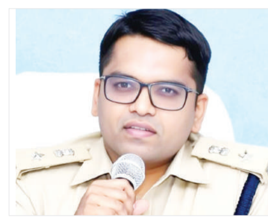
ప్రధానాధ్యక్షుడు ఉంటుందని తెలిపారు. ఒకవేళ మోసగాళ్ల చేత మోసపోయినట్లుంటే వెంటనే (గోల్డెన్ హావర్)లో జాతీయ సైబర్