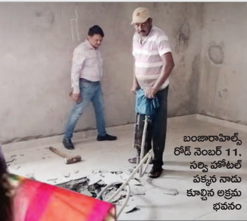
బంజారాహిల్స్ రోడ్ నెంబర్ 11, సర్కిల్ హోటల్ పక్కన నాడు కూల్చిన అక్రమ భవనం