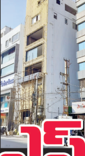
బంజారాహిల్స్ రోడ్ నెంబర్ 11, సర్కిల్ హోటల్ పక్కన నేడు కట్టిస్తున్న అక్రమ కట్టడం