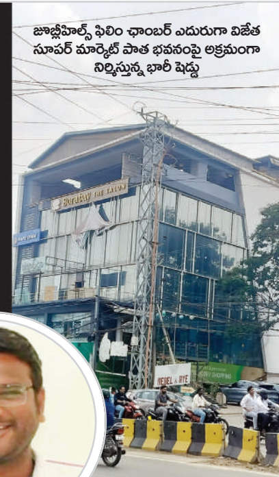
జూబ్లీహిల్స్ ఫిలిం ఛాంబర్ ఎదురుగా విజేత సూపర్ మార్కెట్ పాత భవనంపై అక్రమంగా నిర్మిస్తున్న భారీ షేడ్లు