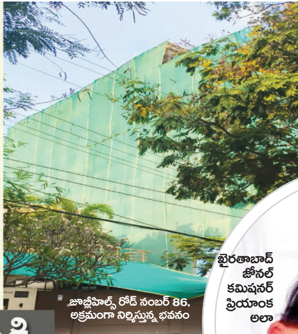
జూబ్లీహిల్స్ రోడ్ నంబర్ 86, అక్రమంగా నిర్మిస్తున్న భవనం