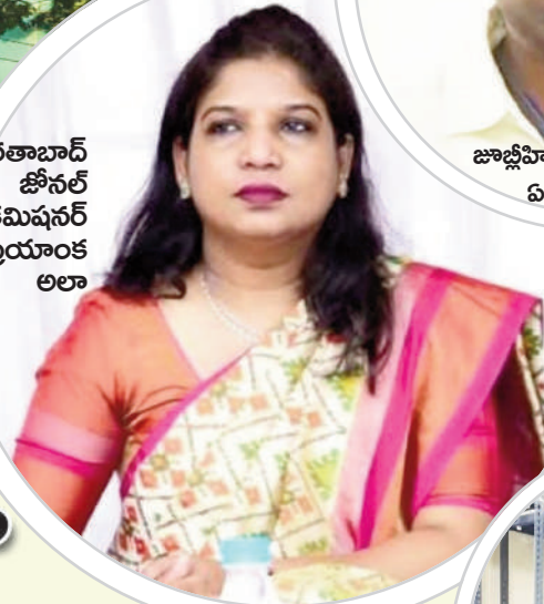
ఖైరతాబాద్ జోనల్ కమిషనర్ ప్రియాంక అలా