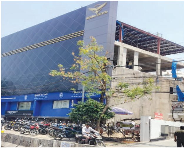
బంజారా హిల్స్ రోడ్ నెంబర్ 12 ఎమ్మెల్యే కాలనీ, ఒమ్మగా ఆసుపత్రి ఎదురుగా ట్రూఫిట్, హిల్ ఓల్డ్ బిల్డింగ్ జిహచ్ఎంసీ నుండి ఎలాంటి అనుమతులు లేకుండా పైన ఒక ఫ్లోర్తో పాటు అక్రమంగా నిర్మిస్తున్న భారీ షెడ్డు