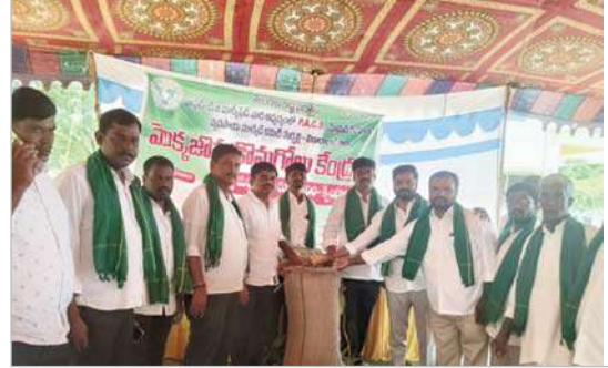
సంఘ సిబ్బంది తదితరులు పాల్గొన్నారు