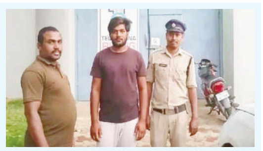
బంట్వారం పోలీస్ స్టేషన్ వీధుల్లో ఉన్న పోలీసులపై దాడి ఇద్దరికీ లమాండ్

నిర్వాహకులు ఏకంగా 95 నుండి 125 మార్గిగజ్ షాట్లలో సుమారు 10 షాట్లను అక్రమంగా విక్రయించింది. సామాన్య ప్రజల అమాయకత్వాన్ని ఆసరాగా చేసుకుని, ప్రభుత్వం దగ్గర ఉంచాల్సిన షాట్లను సైతం రిజిస్ట్రేషన్ పేరుతో అంటగడుతున్నారు. అక్రమాలు కళ్ళమందే జరుగుతున్నాయి. వరుస పత్రికలో కథనాలతో బట్టబయలు చేస్తున్నా.. స్థానిక అధికారులు చర్యలు తీసుకోవడానికి వెనుకడుగు వేస్తుండటం అనుమానాలకు తావిస్తోంది. అధికారుల అండతోనే మార్గిగజ్ షాట్ల విక్రయాలు సాగుతున్నాయా? అని స్థానికులు ప్రశ్నిస్తున్నారు. అధికారుల ఈ మౌనం వెనుక ఉన్న రహస్యమేంటో జిల్లా కలెక్టర్ విచారణ జరపాలని జనం డిమాండ్ చేస్తున్నారు. జిల్లా అధికారులు దృష్టి సారించాలి! రాష్ట్రవ్యాప్తంగా సంఘటనల సృష్టిస్తున్న ఈ 'అక్రమ వేంచర్ల' అక్రమాలపై జిల్లా స్థాయి అధికారులు ప్రత్యేక దృష్టి సారించాల్సిన అవసరం ఉంది. తక్షణమే విచారణ జరిపి, అక్రమ విక్రయాలను అడ్డుకోవడంతో పాటు, నిబంధనలు అతిక్రమించిన యాజమాన్యంపై కఠిన చర్యలు తీసుకోవాలని బాధితులు కోరుతున్నారు. లేనిపక్షంలో ప్రభుత్వ ఆదాయానికి గండి పడటమే కాకుండా, సామాన్య ప్రజలు మోసపోయే ప్రమాదం ఉందని వాపోతున్నారు