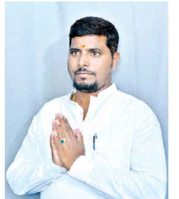
ప్రభుత్వం అని ప్రకాష్ తెలిపారు. ఇప్పటికే కేనా ప్రతి పక్ష పార్టీలు మా ప్రభుత్వంపై అనుచిత వాక్యలు మనుకోవాలని ఆయన తెలిపారు.

రెడ్డిపై అనుచిత వాక్యలు చేస్తూ పబ్లిష్ గడుపుతున్నారని అన్నారు. ప్రభుత్వం చేపట్టిన కొలువులను సాధించిన అభ్యర్థులను కూడా లంచాలు ఇచ్చి ఉద్యోగాలు సంపాదించారని ప్రభుత్వంలో కొందరు లంచాలు తీసుకొని కొలువులను అమ్ముకున్నారుని లేని పోని ప్రాబాలు సృష్టిస్తూ వారి సోషల్ మీడియాలో విశ్రుతంగా ప్రచారం చేస్తున్నారని ప్రజలకు లేని పోని అనుమానాలు కలిగించటానికి ప్రయత్నిస్తున్నారని అన్నారు. ఈ దసర, దీపావలి పండుగా సందర్భంగా గ్రూప్ టు, ద్వారా 783 మందికి నియామక పత్రాలను అందించి కొలువులు సాధించిన అభ్యర్థుల కళ్ళల్లో ఆనందం నింపిన ఏకైక ప్రభుత్వం కాంగ్రెస్