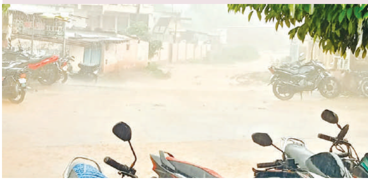
న్యూల్ కల్, సెప్టెంబర్ 16, (జనం సాక్షి):

కల్వర్తులు, వాగుల్లో ఉధృతంగా ప్రవహిస్తున్న వరద