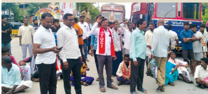
నారాయణపేట జిల్లా బ్యూరో (జనం సాక్షి):

6 రోజులు అయినా టోకెన్లు లభించకపోవడంతో ఆగ్రహం