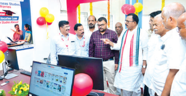
నాగర్ కర్నూల్ జిల్లా బ్యూరో, సెప్టెంబర్ 16 (జనంసాక్షి):