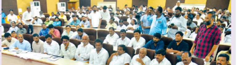
సంగారెడ్డి టౌన్ సెప్టెంబర్ 16 (జనం సాక్షి)