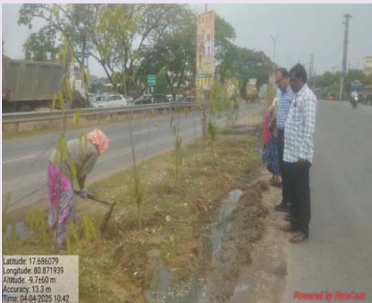
Latitude: 17.686079 Longitude: 80.871939 Altitude: 9.7140 m Accuracy: 13.3 m Time: 04-04-2025 10:42