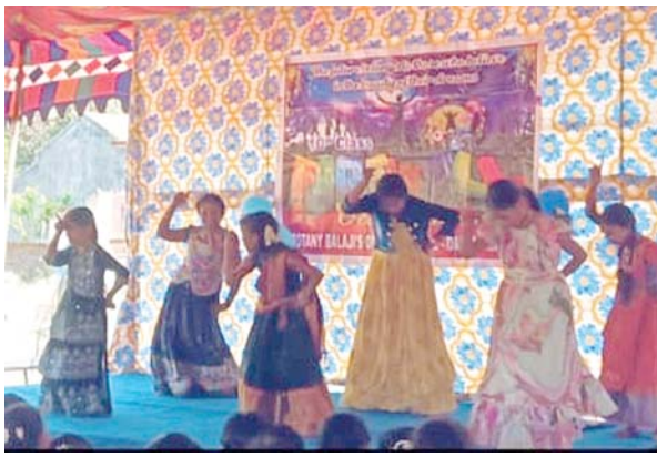
బోటనీ బాలాజీ స్కూల్లో 10వ తరగతి విద్యార్థుల