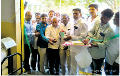
బేక్కాల్ మండల కేంద్రంలో