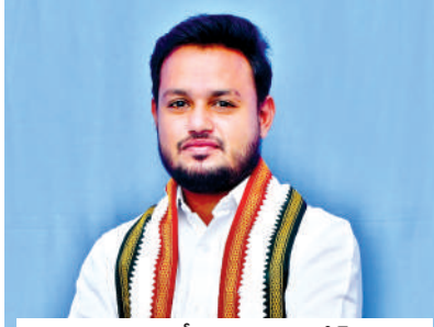
సన్న బియ్యం పంపిణీ చారిత్రాత్మకం : షీక్ సర్కూజ్