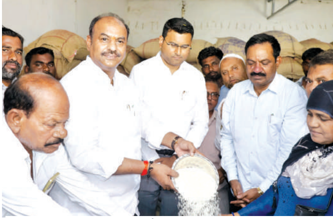
పేదలకు సన్న బియ్యం పంపిణీ చేసిన జిల్లా కలెక్టర్ బి.యం.సంతోష్

పేదలకు సన్న బియ్యం పంపిణీ చేసిన రంగు అశోక్ గౌడ్