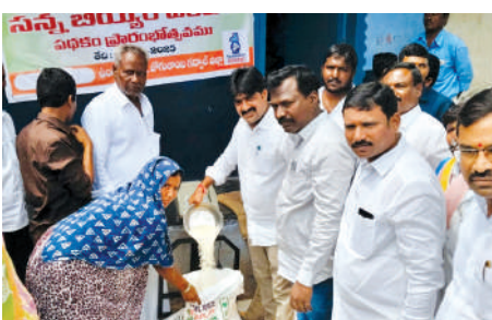
సన్న బియ్యం పంపిణీ చేసిన ఎమ్మెల్యే విజయుడు