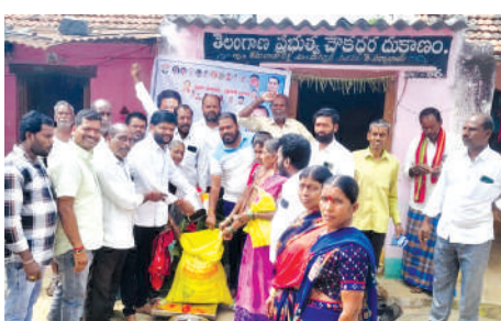
సన్న బియ్యం పంపిణీ ప్రారంభం చేసిన వజ్రోజ, బైతి