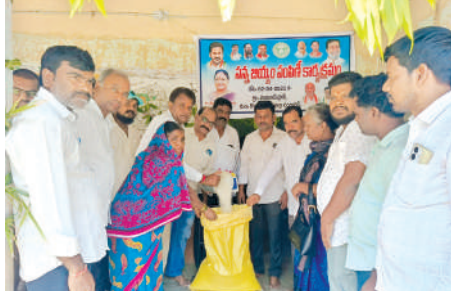
హాలిదాస్ పూర్లో సన్న బియ్యం పంపిణీ