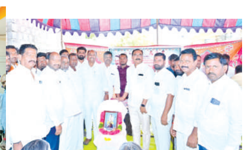
నివాళులర్పించిన ఎమ్మెల్యే బండ్ల