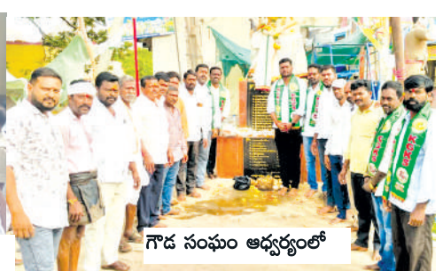
గౌడ సంఘం అధ్యక్షులతో