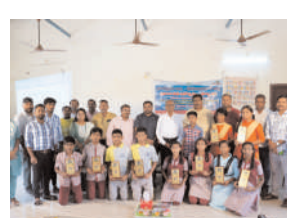
మహబూబాబాద్ జిల్లా కుర్ర మండల కేంద్రంలో భూగర్భ జలాలపై నిర్వహించిన వివిధ పోటీల్లో విజేతలకు బహుమతులు అందిస్తున్న స్థానిక