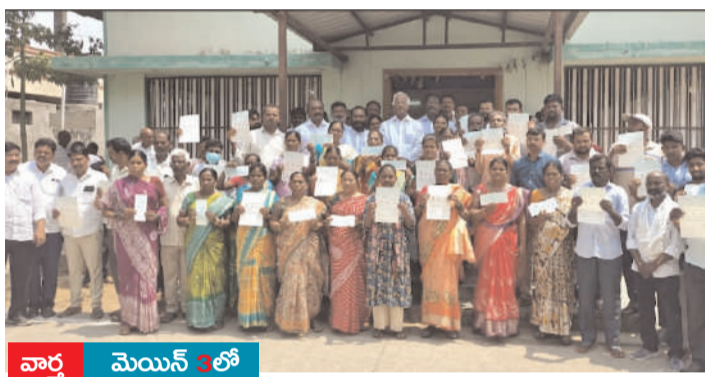
వార్త మెయిన్ 3లో