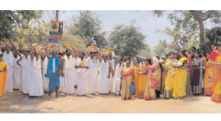
గ్రామంలో సందడి వాతావరణం నెలకొంది.

చెన్నారావుపేట, మార్చి 23 (జనం సాక్షి): మండలంలోని పాపయ్య పేట గ్రామంలో శ్రీ కంఠమహేశ్వర స్వామి ఉత్సవాలను ఘనంగా నిర్వహించారు. ఆదివారం గ్రామంలోని గౌడ కులస్తులు కంఠమహేశ్వర స్వామి, సురమాంబ దేవి, రేణుక ఎల్లమ్మ తల్లి, వనం మైనమ్మలకు బోనాలను సమర్పించారు. అనంతరం బిందెలలో నీటిని తీసుకువెళ్లి జలాభిషేకాలను నిర్వహించారు. అనంతరం మొక్కులను చెల్లించుకున్నారు. దీంతో