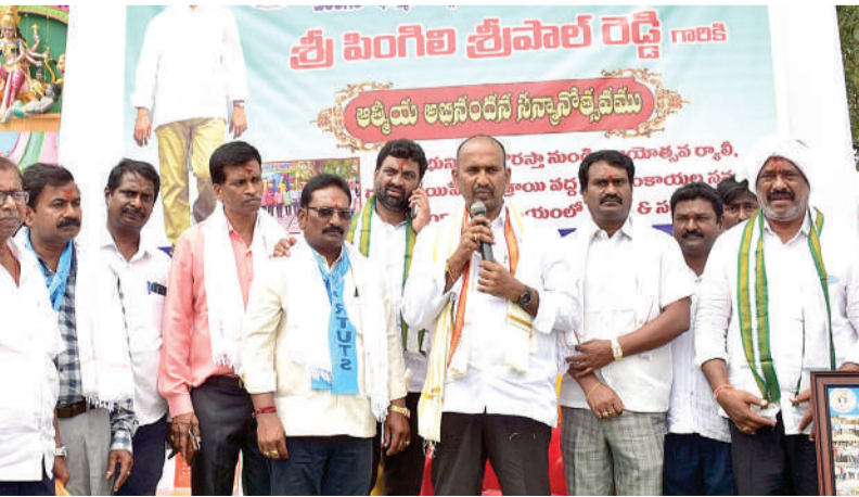
వార్త మెయిన్ 3లో