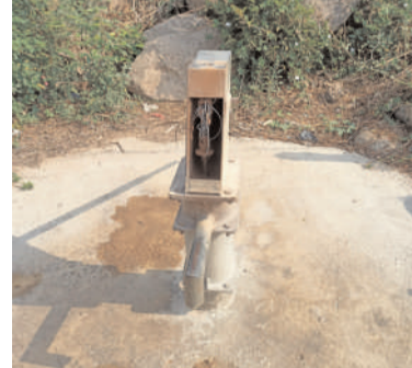
పడుతున్నారు.కాలనీ వాసులు ఎన్ని సార్లు పంచాయతీ అధికారులకు విన్నవించినా, పట్టించుకోవడం లేదని కాలనీ వాసులు అంటున్నారు. చేతి పంపు మిగతా 2లో..

● ప్రజల్ని పట్టించుకోని అధికారులు కడెం, మార్చి 23(జనం సాక్షి) : ఓ వైపు రాష్ట్ర ప్రభుత్వం, నిర్మల్ జిల్లా కలెక్టర్ అభిలాష అభినవ్ వేసవి కాలంలో ప్రజలకి తాగు నీటి సమస్యలు రాకుండా చర్యలు తీసుకోవాలని పలు అధికారులకు,పంచాయతీ సెక్రటరీలకు సూచించినట్లు, కడెం మండలంలోని లింగాపూర్ గ్రామంలో అందుకు విరుద్ధంగా గ్రామ పంచాయతీ సిబ్బంది నడుచుకుంటున్నారు. విషయంలోకి వెళితే లింగాపూర్ గ్రామంలోని ఇందిరానగర్ కాలనీలో చేతి పంపు సరిగా పనిచేయక సుమారుగా నెల రోజులు గడుస్తున్న పంచాయతీ సిబ్బంది చేతి పంపును బాగు చేయించకపోవడంతో సుమారుగా 30 కి పైనే కుటుంబాలు నీటి సమస్యతో ఇబ్బంది