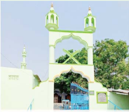
Makkah Masjid Devarakonda