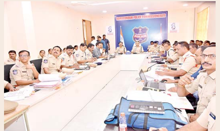
వార్తా మెయిన్ పేజీలో