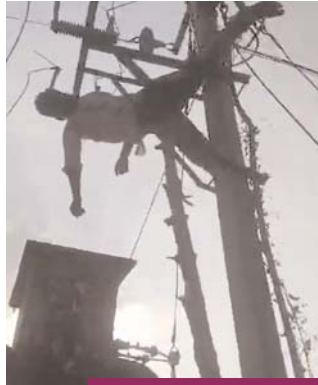
వార్తా లోపలి పేజీలో