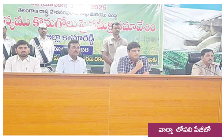
వార్తా లోపలి పేజీలో