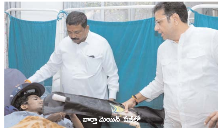
వార్తా మెయిన్ పేజీలో

క్యాన్సర్ బాధితుడి మాటలకు మంత్రి శ్రీధర్ బాబు కన్నీళ్లు!