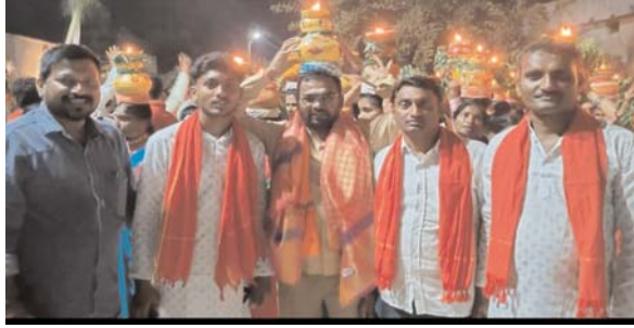
ఎల్లమ్మ తల్లి బోనాల కార్యక్రమంలో పాల్గొన్న