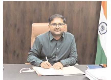
స్టేడియం కి వచ్చి పరీక్షలో పాల్గొనవచ్చును కలెక్టర్ ఆ ప్రకటనలో పేర్కొన్నారు.

దేహదారుఢ్య, మెడికల్, వ్రాత పరీక్షలు నిర్వహించి ఉత్తీర్ణులైన అభ్యర్థులకు ఉచిత రాత పరీక్షకు సంబంధించిన మరియు శరీర దారుఢ్యము కి సంబంధించిన శిక్షణ ఇవ్వడం జరుగుతుందని తెలిపారు.మార్చి 28న అర్హత కలిగిన అభ్యర్థులకు ఉచితంగా ఫిజికల్ టెస్ట్, మెడికల్ టెస్ట్ నిర్వహించడం జరుగుతుందని, జిల్లాలోని యువత ఈ అవకాశాన్ని సద్వినియోగం చేసుకుని ఉద్యోగం సాధించాలని, దీనికి 17 1/2 నుంచి 21 సంవత్సరాల మధ్య వయసు ఉన్న అభ్యర్థులు అర్హులని,ఆసక్తి, అర్హత గల అభ్యర్థులు నేరుగా