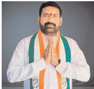
నాయకులు శ్రీయోభిలాషులు అభిమానులు ప్రతి ఒక్కరూ పాల్గొనాలని ఆయన విజ్ఞప్తి చేశారు.