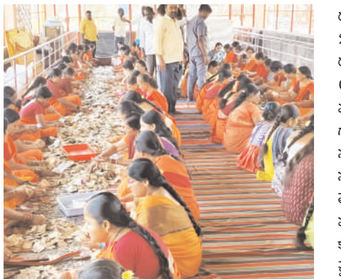
గద్వాల రూరల్ మార్చి 28(జనంసాక్షి) : శ్రీ జమ్మలమ్మ, పరశురామస్వామి దేవస్థానము హుండీల లెకింపు 65 రోజులకు మొత్తం 27,78,778