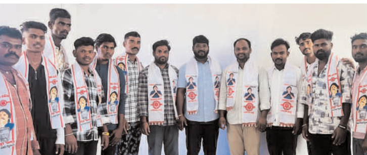
మక్తల్, మార్చి 28 (జనంసాక్షి)