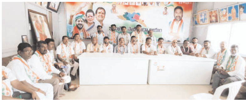
మక్తల్, మార్చి 28 (జనంసాక్షి)