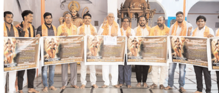
మక్తల్, మార్చి 28 (జనంసాక్షి)

ఏప్రిల్ 12వ తేదీ శనివారం జరగబోయే వీర హనుమాన్ విజయోత్సవ శోభాయాత్ర గోడ పత్రికను విశ్వహిందూ పరిషత్ బజరంగ్ దళ్ మక్తల్ ప్రఖండ నాయకులు విడుదల చేశారు. ఈ సందర్భంగా స్థానిక మక్తల్ పట్టణంలోని పడమటి ఆంజనేయ స్వామి దేవాలయంలో శ్రీ రామ గ్రామోత్సవాలు విజయవంతం చేయాలని పిలుపునిచ్చారు. ఈ సందర్భంగా శ్రీరామ గ్రామోత్సవ గోడపత్రిక ను విడుదల చేశారు. ఈ సందర్భంగా వారు మాట్లాడుతూ సమస్త హిందూ బంధువులకు విశ్వ వసు ఉగాది నామ నూతన సంవత్సర శుభాకాంక్షలు తెలియజేశారు. శ్రీరామనవమి సందర్భంగా గ్రామ గ్రామాన శ్రీ రామ కళ్యాణం యువకులు కోలాటం