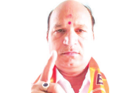
ఉపముఖ్యమంత్రి డీకే శివ కుమార్ పంజాబ్ ఆఫ్ నేత ఉన్నారని అన్నారు. వీరంతా దేశం కోసం ప్రజల కోసం పని చేస్తున్న బిజెపిని అడ్డుకోవాలని పని చేస్తున్నాయని అన్నారు. ప్రజలు వాస్తవాన్ని గుర్తించి ఆయా పార్టీల కు తగిన బుద్ధి చెప్పాలని కోరారు.