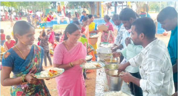
చిన్న శంకరం పేట మార్చి 22 (జనంసాక్షి)

మండలంలోని గజగట్ల పల్లి గ్రామంలో పెద్దమ్మ దేవాలయంలో పెద్దిరాజు పెద్దమ్మ కళ్యాణం ఉత్సవాన్ని శనివారం రోజు అంగరంగ వైభవంగా నిర్వహించారు. ఈ కళ్యాణోత్సవానికి పెద్ద ఎత్తున ప్రజలు హాజరయ్యారు. ఉదయం అభిషేకం మధ్యాహ్నం అమ్మవారి కళ్యాణం తరువాత అన్నదాన కార్యక్రమం జరిగింది. సాయంత్రం పెద్దమ్మకు బోనాలు ఈ కార్యక్రమంలో ముదిరాజులు గ్రామస్తులు పెద్ద ఎత్తున పాల్గొన్నారు.