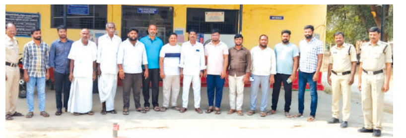
చారకొండ, మార్చి 22