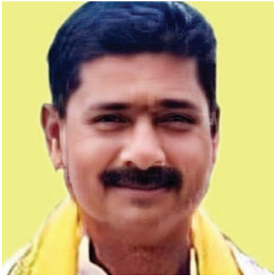
తగిన బుద్ధి చెప్పా మని అన్నారు.

తుంగలో తొక్కి కాంగ్రెస్ పార్టీ విఫలమైందని అన్నారు. అందుకే బడుగు బలహీన వర్గాల ఆశాజ్యోతి నందమూరి తారక రామారావు స్థాపించిన తెలుగుదేశం పార్టీ వైపు చూస్తున్నారు. పటేల్ పట్టణ వ్యవస్థ నుండి ప్రజలు ఇబ్బంది పడుతున్నారని ఆ వ్యవస్థను రద్దు చేసిన మహానుభావుడు కూడు గుడ్ల లేనివారికి ప్రభుత్వ పథకాలు చెందాలని అనే నినాదంతో ప్రజల మనసును దోచుకున్న ఆ మహానుభావుడి స్థాపించిన తెలుగుదేశం పార్టీ బలపరిచిన అభ్యర్థులను గెలిపించడానికి సిద్ధంగా ఉన్నారు. అందుకే స్థానిక సంస్థ ఎన్నికల్లో తెలుగుదేశం పార్టీ సత్తా ఏమిటో చూపించి కాంగ్రెస్ ప్రభుత్వానికి