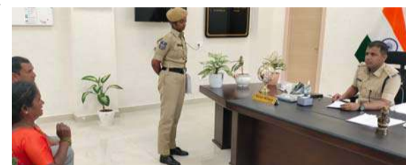
భూపాలపల్లి, మార్చి 24 (జనం సాక్షి)