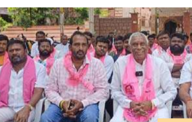
ఎమ్మెల్యే ప్రేమ్ సాగర్ రావు అక్రమ పన్నులకు తెరలేపారని, కోట్లాది రూపాయల పన్నులు చేస్తున్నారని వాణిజ్య వ్యాపార సంస్థల యజమానులు, అధికారులను ప్రతినిధి దబ్బులు ఇవ్వాలని బెదిరింపులకు పాల్పడుతున్నారని మంచిర్యాల మాజీ ఎమ్మెల్యే దివాకర్ రావు ఆరోపించారు.

మంచిర్యాల నియోజకవర్గం లో ఎమ్మెల్యే ప్రేమ్ సాగర్ రావు అక్రమ పన్నులకు తెరలేపారని, కోట్లాది రూపాయల పన్నులు చేస్తున్నారని వాణిజ్య వ్యాపార సంస్థల యజమానులు, అధికారులను ప్రతినిధి దబ్బులు ఇవ్వాలని బెదిరింపులకు పాల్పడుతున్నారని మంచిర్యాల మాజీ ఎమ్మెల్యే దివాకర్ రావు ఆరోపించారు. సోమవారం నాడు మంచిర్యాల జిల్లా కేంద్రంలోని మంచిర్యాల మాజీ శాసనసభ్యులు నడిపల్లి దివాకర్ రావు తెలిపారు. అధికారులు తప్పు చేస్తే వారిపై సమావేశంలో ఆయన మాట్లాడుతూ... ప్రేమ్ సాగర్ రావు పన్నుల వర్షం మంచిర్యాల పట్టణంలో కొనసాగుతుందని ఆయన అన్నారు. కలెక్టర్ ఆఫీస్ సమీపంలో 42 సర్వే నెంబర్ లో అక్రమ నిర్మాణాలు అని చెప్పి కాలా కొట్టిన ఇండ్లను నడచి ఎమ్మెల్యే దివాకర్ రావు కొనసాగుతున్నారని ఆ నిర్మాణాలను కొనసాగించడానికి కోట్లాది రూపాయల అక్రమ పన్నులు చేశారని ఆరోపించారు. మంచిర్యాల పట్టణంలో ఉమర్ మియా సాసైటీలో ఇంటికి 6 లక్షల చొప్పున ఉండే 60 ఫ్లాట్లు ప్లాట్ల యజమానుల నుండి 6 లక్షల చొప్పున పన్నులు చేశారని పేర్కొన్నారు. మంచిర్యాల పట్టణంలోని వ్యాపారస్థులూ వ్యాపారస్థుల దగ్గర దాదాపు 40 లక్షల పన్నులు చేశారని పేర్కొన్నారు. మంచిర్యాల పట్టణంలో మరోక బిల్డింగ్ కాల కొట్టకుండా ఉండడానికి 50 లక్షల రూపాయల పన్నులు చేశారని ఆరోపించారు. లక్ష్మిపేట, హాజీపూర్ మండలలో సహజంగా ఏర్పాటు చేసిన వెంచర్ యజమానుల దగ్గర కోట్లాది రూపాయలు పన్నులు చేస్తున్నారని తెలిపారు. ఇటీవల చెరువు ఎఫ్డీఎల్ పరిధి అనే నెంబర్ రెండు మండల రూపాయలలో కోటి రూపాయలు ముట్టాయి. ఎఫ్డీఎల్ విషయంలో దబ్బులు ఇచ్చి మోసపోకండి, మీరు దబ్బులు ఇచ్చినంత