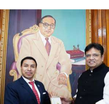
యా.ఎన్. ఇండియానా రాష్ట్ర ప్రభుత్వ ప్రతినిధులను కోసం మంత్రి దుద్దిళ్ల శ్రీధర్ బాబు