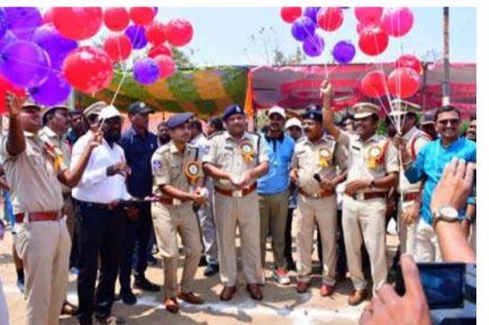
కొమరం భీమ్ ఆసిఫాబాద్ జిల్లా బ్యూరో మార్చి 24 (జనం సాక్షి)