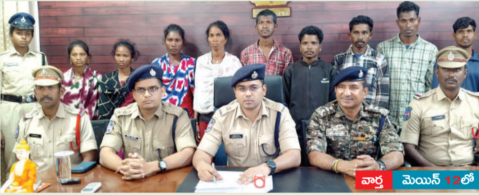
వార్త మెయిన్ 12లో

ములుగు పోలీసుల ఆధ్వర్యంలో జనజీవన స్రవంతిలోకి..