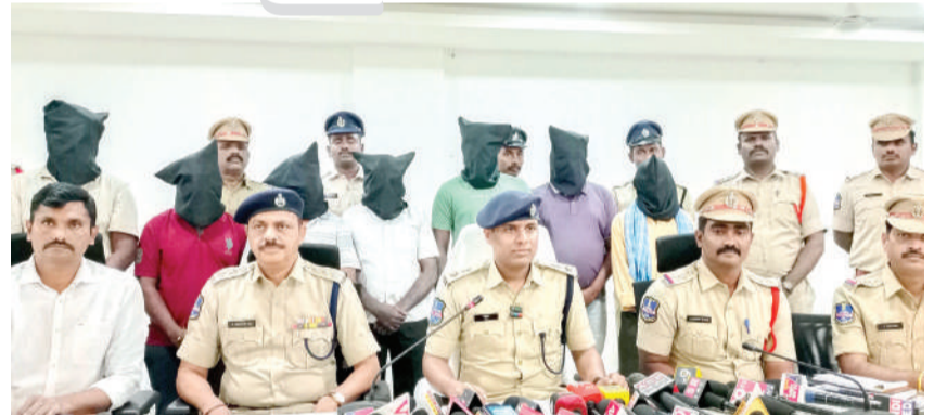
వార్త మెయిన్ 12లో