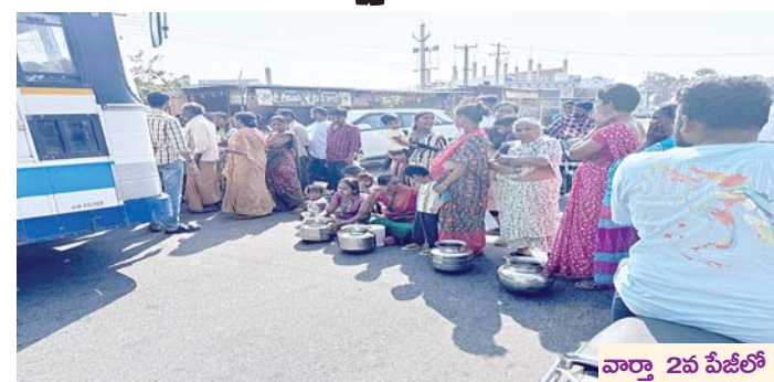
వార్తా 2వ పేజీలో