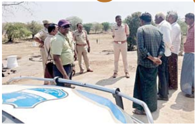
వేలాదిమంది భక్తులు తెలంగాణ ఆంధ్రప్రదేశ్