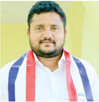
కాలయాపన చేయడం సరికాదన్నారు.

కోసం వారు చేయని ప్రయత్నమంటూ లేదు. అన్ని రాజకీయ పార్టీలు రేపు మాపు అని చెప్పి చేతులు దులుపుకుంటున్నాయని అన్నారు. ఈ రాష్ట్ర ప్రభుత్వం అయినా వారి యొక్క సమస్యల పరిష్కారానికి వెంటనే చర్యలు తీసుకోవాలని సిఎం రేవంత్ రెడ్డి గారికి బీసీ సంక్షేమ సంఘం ద్వారా విజ్ఞప్తి చేస్తున్నాం. తాము అధికారంలోకి రాగానే జర్నలిస్టులకు ఇండ్ల స్థలాల్నిస్తామని గత ఎన్నికల్లో హామీ ఇచ్చిన కాంగ్రెస్ ఇప్పుడు సుప్రీంకోర్టు తీర్పును సాకుగా చూపి జర్నలిస్టులకు ఇండ్ల స్థలాలు ఇవ్వకుండా