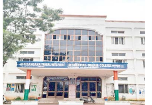
పాటించి సెంటర్ కు హాజరు కావాలని తెలిపారు.