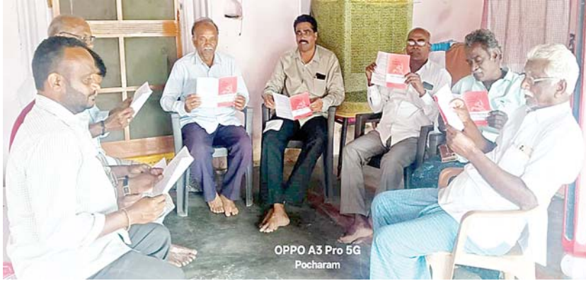
OPPO A3 Pro 5G Pocharam