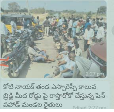
కోటి నాయక్ తండ్రి ఎస్సారెస్పీ కాల్యవ బ్రిడ్జి మీద రోడ్డు పై రాస్తారోకో చేస్తున్న పెన్ పహాణి మండల రైతులు

దంతాలపల్లి ప్రధాన రహదారికోటి నాయక్ తండ్రి %ంతుంజూ% కాల్య బ్రిడ్జి పై ఆందోళనకు దిగారు. వార బంది ప్రకారం ఈ నెల 16న గోదావరి జిల్లాలు విడుదల చేసిన అధికారులు ప్రధాన కాల్యపకు నిల్లు అందించకుండా 36ఎల్ కాల్య ద్వారా మోతే మండలానికి మాత్రమే నీళ్లు తరలించడం పట్ల నిరసన వ్యక్తం చేశారు. అధికారులు నీటి సరఫరా ఇవ్వడంలో పక్షపాతం ఇస్తున్నారు అంటూ నిరసనకారులు ఆందోళన వ్యక్తం చేశారు. నీటిని విడుదల చేసిన అధికారులు గేట్ల వద్ద సిబ్బందిని రక్షణ కోసం ఏర్పాటు చేయక పోవడం తో రాత్రి వేళల్లో గుర్తు తెలియని కొందరు వ్యక్తులు మెయిన్ కాల్యవ గేట్లు ముసివేసి నీళ్లు మల్లిస్తున్నారంటూ ఆరోపించారు. గత 10రోజుల క్రితం గుర్తు తెలియని వ్యక్తులు ఏకంగా ప్రధాన కాల్య గేట్ల కు వెల్లింగ్ లు చేసినా అధికారులు చర్యలు తీసుకోలేదని ఆరోపించారు.జిల్లా కలెక్టర్ రావాలంటూ నినాదాలు చేశారు.ఇరిగేషన్ ఏ ఏఈ డౌన్ డౌన్ అంటూ నినాదాలు